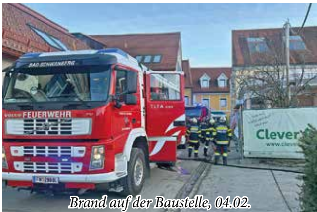
Brand auf der Baustelle, 04.02.

Zu einem Brand auf einer Baustelle in der Raiffeisengasse wurden wir in den Nachmittagsstunden des 4. Februar, durch die Polizei, alarmiert. Laut Alarmstichwort „B05-Zimmerbrand“ wurden die Feuerwehren Grünberg-Aichegg und Steyeregg ebenso entsandt. Im Erdgeschoss eines in Bau befindlichen Objekts war es zu einem Brand von Kunststoffelementen der Gebäudedämmung gekommen. Die Brandursache ist Gegenstand polizeilicher Ermittlungen. Durch den raschen Eingriff und die gute Zusammenarbeit der Feuerwehren konnte ein größerer Schaden verhindert werden.