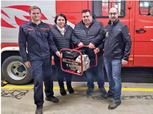
Übergabe der Schmutzwasserpumpe

In den mittlerweile allsommerlich auftretenden Unwettersaisonen wird es uns mit dieser Pumpe künftig möglich sein, noch rascher zu helfen. Vielen herzlichen Dank!