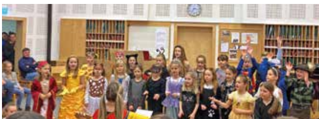
Auftritt des Schulchores im Rahmen des Vorspielabends

Die Sänger:innen der Volksschule Hollenegg begeisterten im Advent viele Zuhörer:innen und mit ihren musikalischen Darbietungen. Schon am ersten Adventsonntag, gestaltete der Schulchor den Gottesdienst mit Adventkranzsegnung. Eine Woche später standen die Kinder des Schulchores sowie die Gruppe Musikalische Früherziehung beim Adventkonzert der Musikkapelle Hollenegg, am 9. Dezember, auf der großen Bühne. Die Einstimmung auf die Vorweihnachtszeit am 17. Dezember war auch heuer wieder ein großer Erfolg. Eine Veranstaltung, bei der verschiedene Musikgruppen aus Hollenegg wie Kindergarten, Musikschule, Musikkapelle und Volksschule gemeinsam den weihnachtlichen Zauber spürbar machten. Zuletzt begrüßten die jungen Sänger:innen das Publikum des jährlichen Adventspiels im Turnsaal der Volksschule am 22. Dezember,