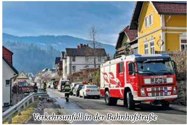
Verkehrsunfall in der Bahnhofstraße

Zu einem Auffahrunfall mit verletzten Personen wurden wir am 2. Februar in die L649/Bahnhof-