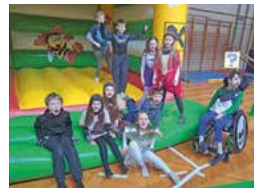
Faschingsnarren der 4. Klasse

Seiten. Die Menge tobte, klatschte und sang zur Musik. Faschingskrapfen sind an so einem Tag ein Muss. Vielen Dank an die Marktgemeinde Bad Schwanberg , die diese von der Bäckerei Schmuck