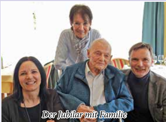
Der Jubilar mit Familie

Wir wünschen dem Jubilar noch viele Jahre in geistiger Frische an der Seite seiner lieben Gattin, seiner Familie und vor allem auch im Kreise vieler Schwanbergerinnen und Schwanberger!