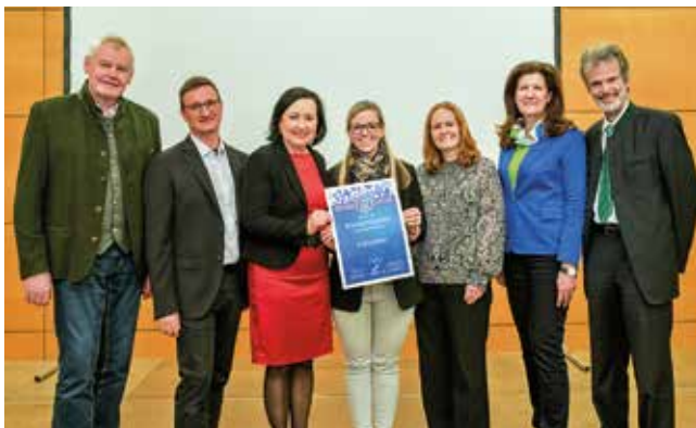
Meistersinger-Gütesiegel Verleihung in Graz

eEducation-Expertschule und MINT-Schule . Diese Gütesiegel wiederzuerlangen ist nur mit engagierten Lehrer:innen sowie interessierten Schüler:innen möglich und darauf können wir sehr stolz sein.