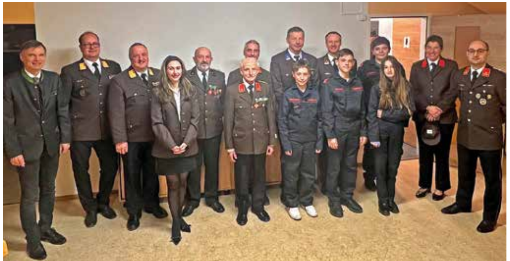
Die Geehrten und Beförderten der diesjährigen Wehrversammlung