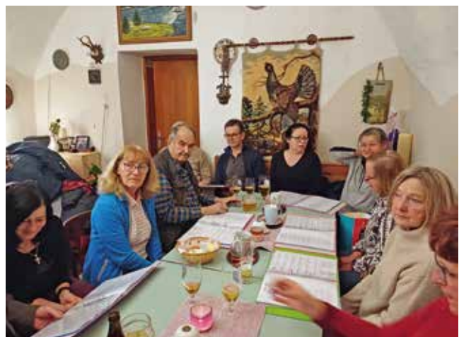
Gemeinsames Singen im Gasthaus Sonja