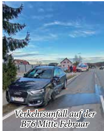
Verkehrsunfall auf der B76 Mitte Februar

Erneut zu einem Unfall, diesmal auf der B76 am Ortsende von Bad Schwanberg, in Richtung Wies, wurden wir am Nachmittag des 14.02. gerufen. Zwei Fahrzeuge waren nach einem missglückten Überholvorgang frontal, aber seitlich versetzt miteinander kollidiert.